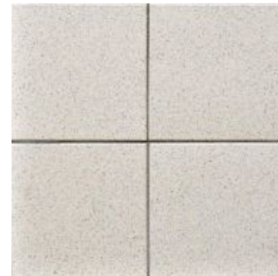
Keraselect pompeii beige