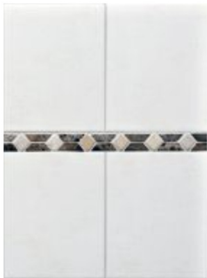
Keraselect FE840 beige